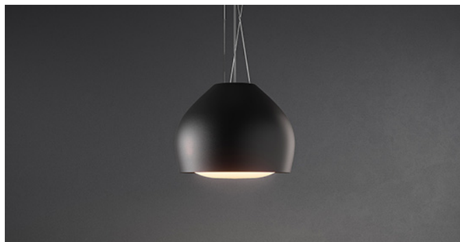
Снимката е само за информация Може да не отговаря на избрания модел